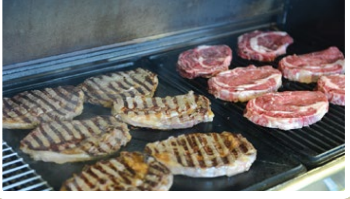
Rundvlees van echte vleesrassen met karakter

Gedurende de overtocht van Australië naar Europa krijgt het grain-fed rundvlees voldoende tijd om bij een strikt gecontroleerde temperatuur te rijpen. Dit maakt het voor ons mogelijk om de malsheid, de sappigheid en de smaak van dit vlees te garanderen. Van deze unieke kwaliteit Australisch rundvlees 1788 biedt HANOS naast de bekende delen van de achtervoet ook gewenste snitten van de voorvoet aan.