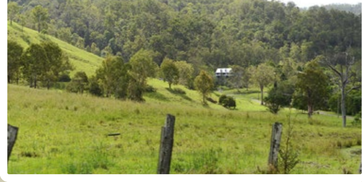
Op de uitgestrekte weidegronden kunnen de runderen naar hartelust grazen

Voor een periode van 26 maanden graast het vee op de uitgestrekte vlaktes, waarna ze worden ondergebracht in een zogenaamde feedlot. Met een zorgvuldig samengesteld voederrantsoen met als belangrijkste component graan, aangevuld met natuurlijke bestanddelen als gras en mais, wordt het vee minimaal 120 dagen afgemest. Dit speciale 'dieet' zorgt voor de prachtige marmering van het vlees. Dit intramusculaire vet draagt bij aan de superieure malsheid, de sappigheid en de rijke, natuurlijke 'melt-in-the-mouth' smaak van dit rundvlees.